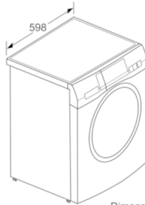
Dimensiones en mm